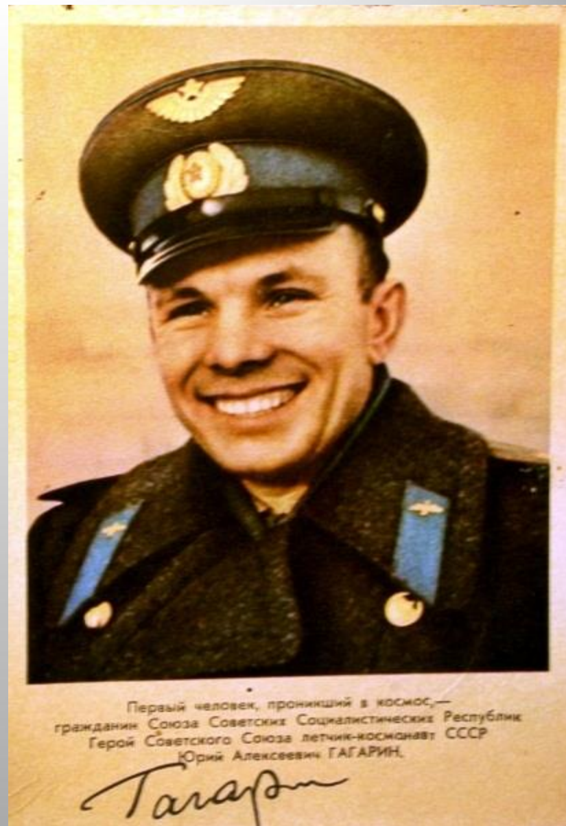
Первый человек, проникший в космос, — гражданин Союза Советских Социалистических Республик Герой Советского Союза летчик-космонавт СССР Юрий Алексеевич ГАГАРИН.

Не попросив подмог ни у кого, Сама восстав из пепла и из праха, Моя страна, не знающая страха, Шлет в космос ныне сына своего.